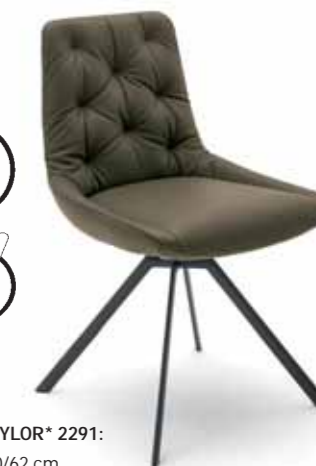
STUHL TAYLOR* 2291: BHT 53/90/62 cm