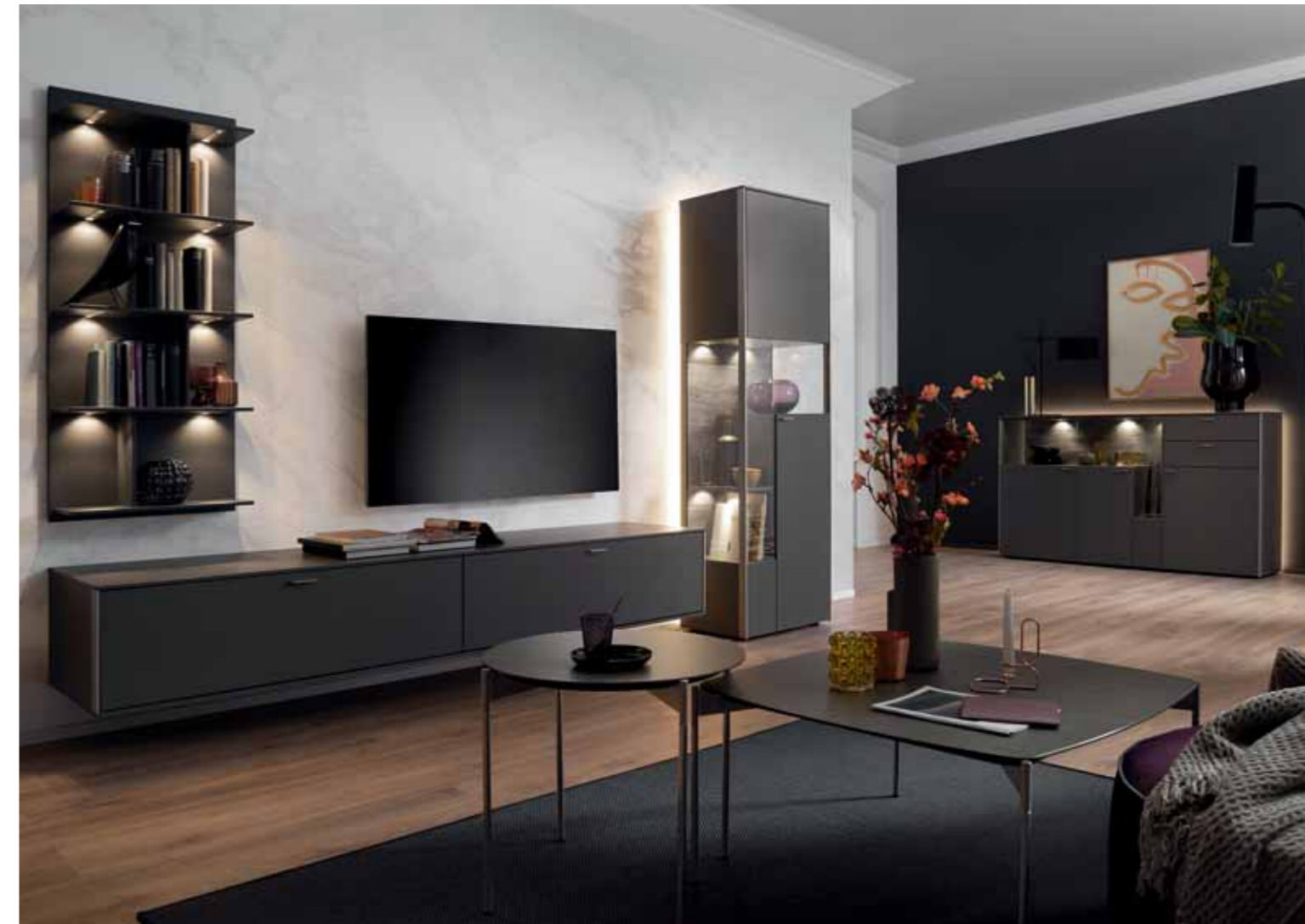
Kombination SI04-3617L: BHT 324/207/53 cm • Sideboard 5263-3617R: BHT 182/105/43 cm • Lack schiefergrau matt, Fjord Fichte grau • Aluleiste metallfarbig matt • Couchtisch RIO* 4942-1766M: LBH 83/83/42 cm • Beistelltisch RIO* 4946-1766L: LBH Ø 55/49 cm • Edelstahl optik, Keramik pazifikgrau