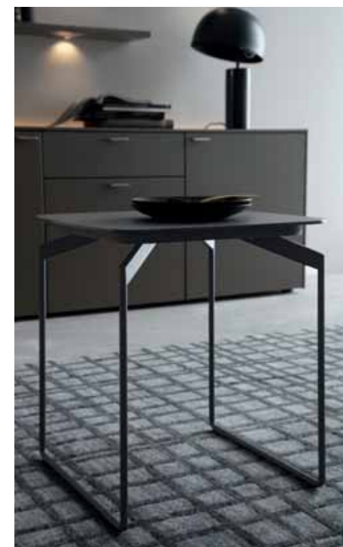
Beistelltisch CANNA* 4540-1866L: LBH 43/43/49 • Metall anthrazit matt • Keramik pazifikgrau