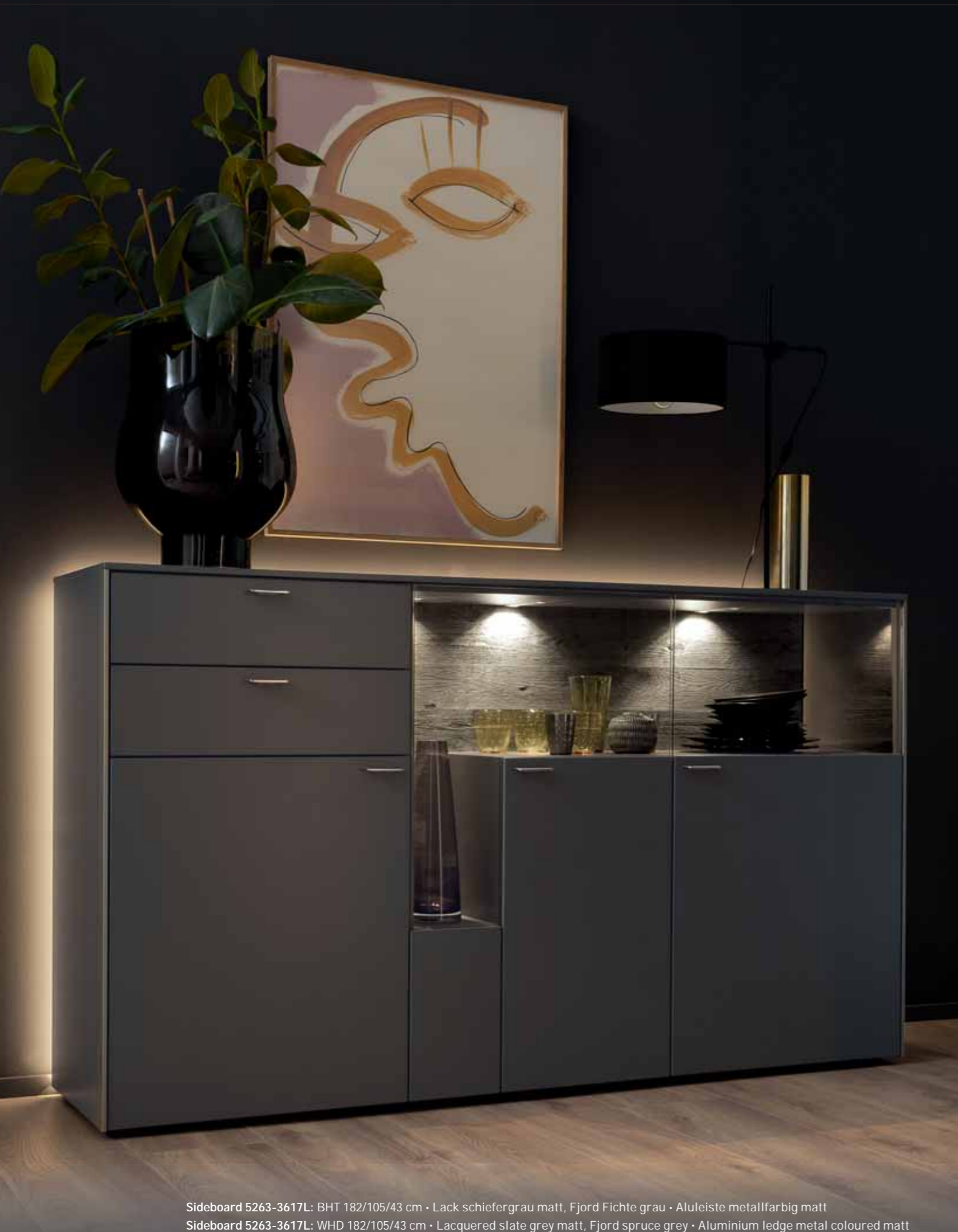
Sideboard 5263-3617L: BHT 182/105/43 cm • Lack schiefergrau matt, Fjord Fichte grau • Aluleiste metallfarbig matt Sideboard 5263-3617L: WHD 182/105/43 cm • Lacquered slate grey matt, Fjord spruce grey • Aluminium ledge metal coloured matt